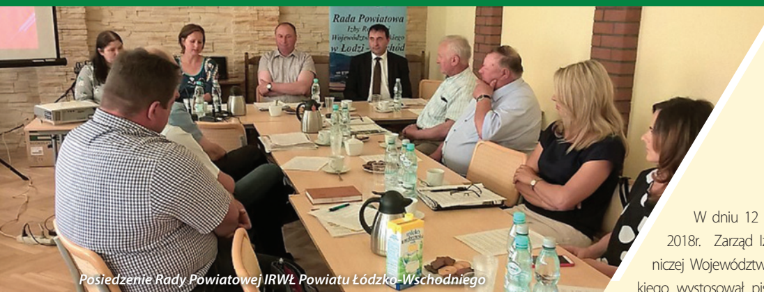
Posiedzenie Rady Powiatowej IRWŁ Powiatu Łódźko-Wschodniego