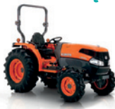
L5040 Moc: 51 KM