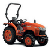
L1361 Moc: 36,6 KM