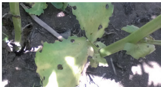
Wżery zatkowe w bobiku - uszkodzenia przez oprzędzika

Zaraz po wschodach roślin na plantacjach mogą pojawiać się oprzędziki . Występuje kilka gatunków tych owadów m. in. oprzędzik pęgowany, oprzędzik wielożerny i oprzędzik szary. Owady dorosłe żywią się organami wegetatywnymi roślin, a larwy niszczą brodawki korzeniowe roślin. Chrząższcze uszkadzają lub niszczą kielki wschodzących roślin