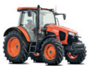
M5091 Moc: 95 KM