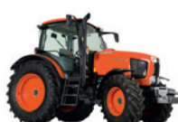
M125GX III Moc: 133 KM