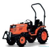
B2420 Moc: 21,5 KM