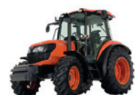
M7060 Moc: 74 KM