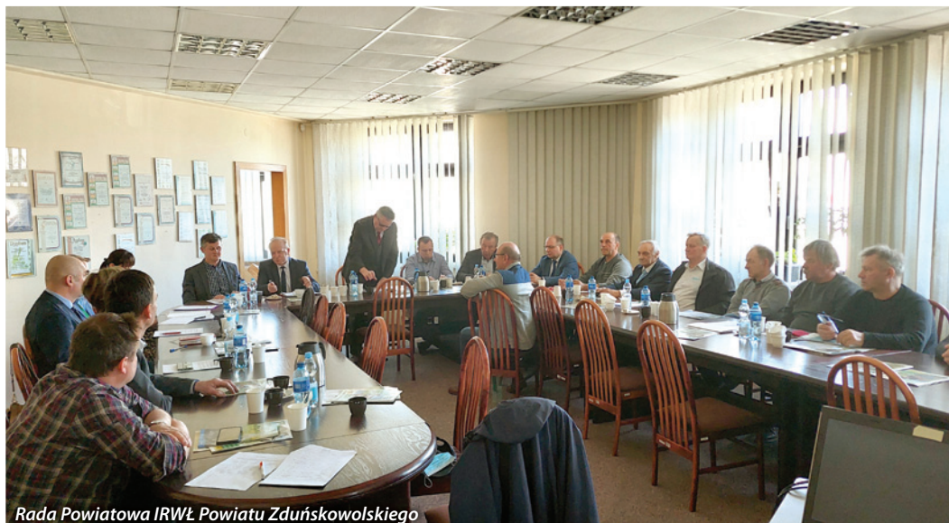
Rada Powiatowa IRWŁ Powiatu Zduńskowolskiego

W miesiącu marcu 2022r. odbyło się 12 posiedzeń Rad Powiatowych IRWŁ (w dniu 7.03.2022r. powiatu łaskiego, w dniu 10.03.2022r. powiatu brzezińskiego i zgierskiego, w dniu 11.03.2022r. powiatu łowickiego, w dniu 14.03.2022r. powiatu kutnowskiego, w dniu 15.03.2022r. powiatu wieluńskiego, w dniu 18.03.2022r. powiatu pabianickiego, w dniu 21.03.2022r. powiatu radomszczańskiego, w dniu 22.03.2022r. powiatu piotrkowskiego i skierniewickiego, w dniu 24.03.2022r. powiatu zduńskowolskiego, w dniu 31.03.2022r. powiatu łódzkiego-wschodniego). Członkowie dyskutowali o trudnej sytuacji w rolnictwie spowodowanej m.in. wysokimi cenami środków do produkcji rolnej a przedstawiciele ARiMR przedstawili informacje na temat naboru wniosków w zakresie płatności bezpośrednich na rok 2022. Natomiast przedstawiciele insty-