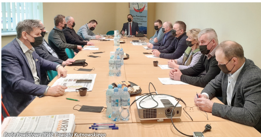
Rada Powiatowa IRWŁ Powiatu Kutnowskiego

tuji sektora rolnego (m.in. KRUS-u, KOWR-u, Inspekcji Weterynaryjnej) przedstawili bieżące informacje.