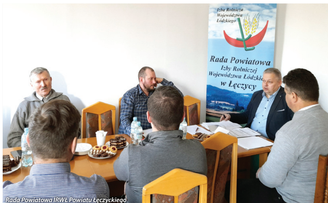
Rada Powiatowa IRWŁ Powiatu Łęczyckiego