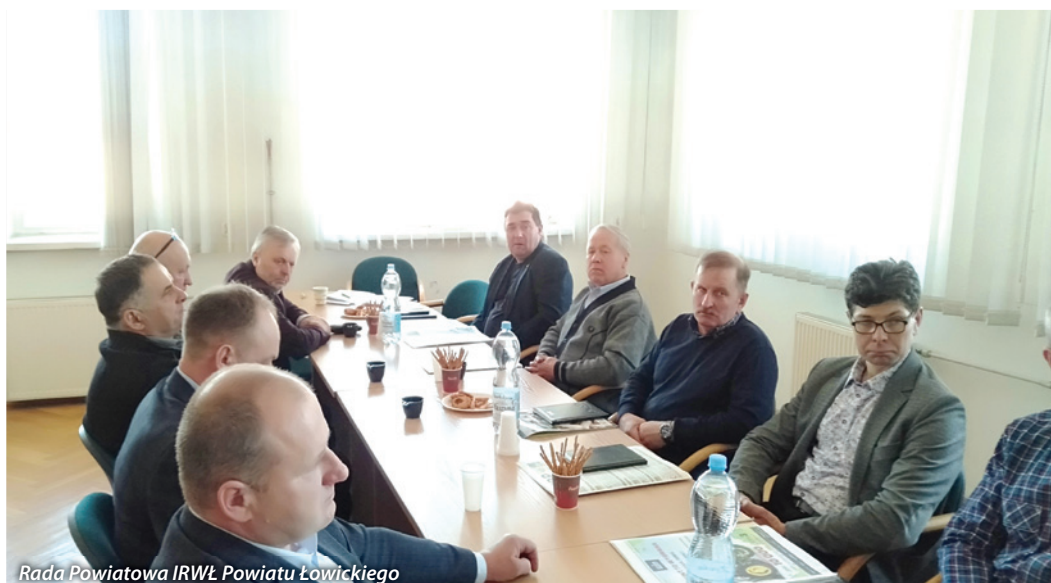
Rada Powiatowa IRWŁ Powiatu Łowickiego