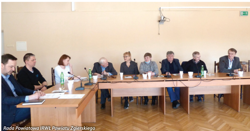
Rada Powiatowa IRWŁ Powiatu Zgierskiego

niczej AGROTECH. W targach wzięli udział rolnicy z województwa łódzkiego.