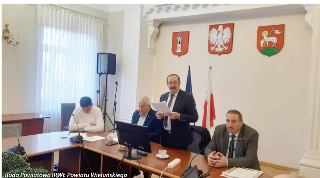
Rada Powiatowa IRWŁ Powiatu Wieluńskiego