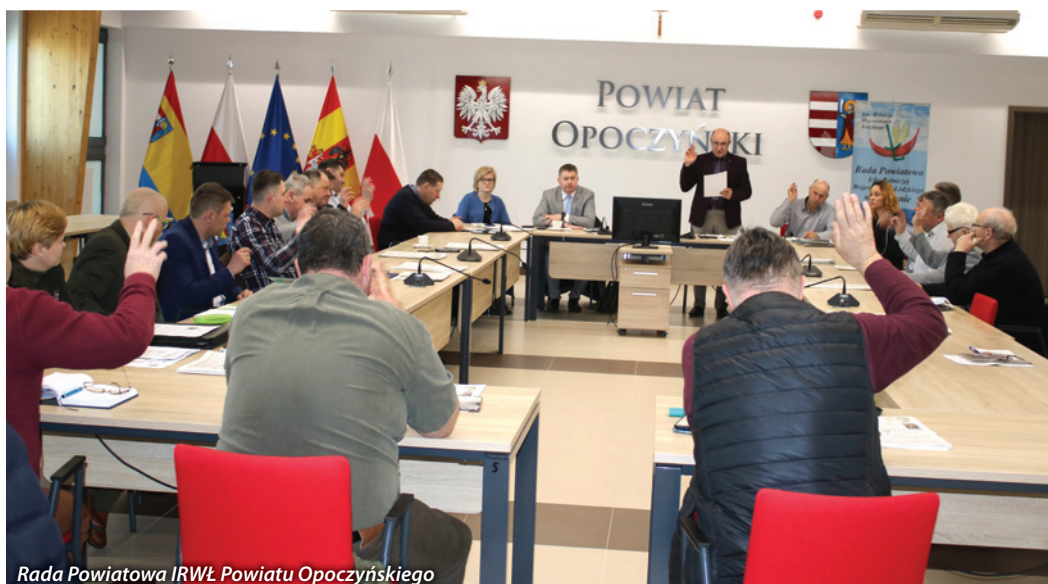
Rada Powiatowa IRWŁ Powiatu Opczyńskiego