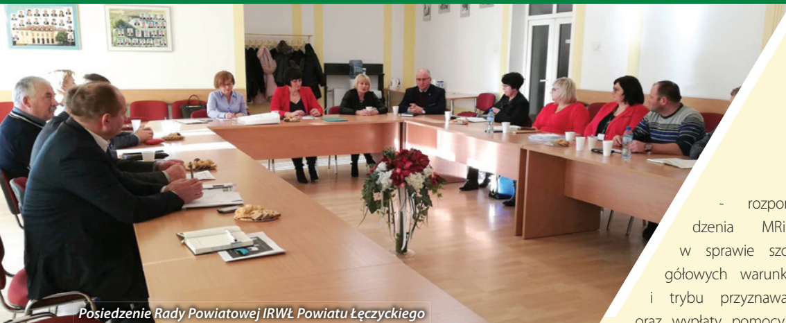
Posiedzenie Rady Powiatowej IRWŁ Powiatu Łęczyckiego