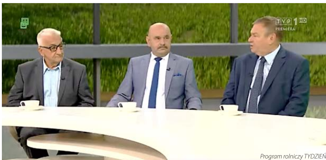
Program rolniczy TYDZIEŃ