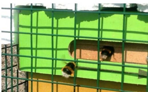
Ul z trzmielami