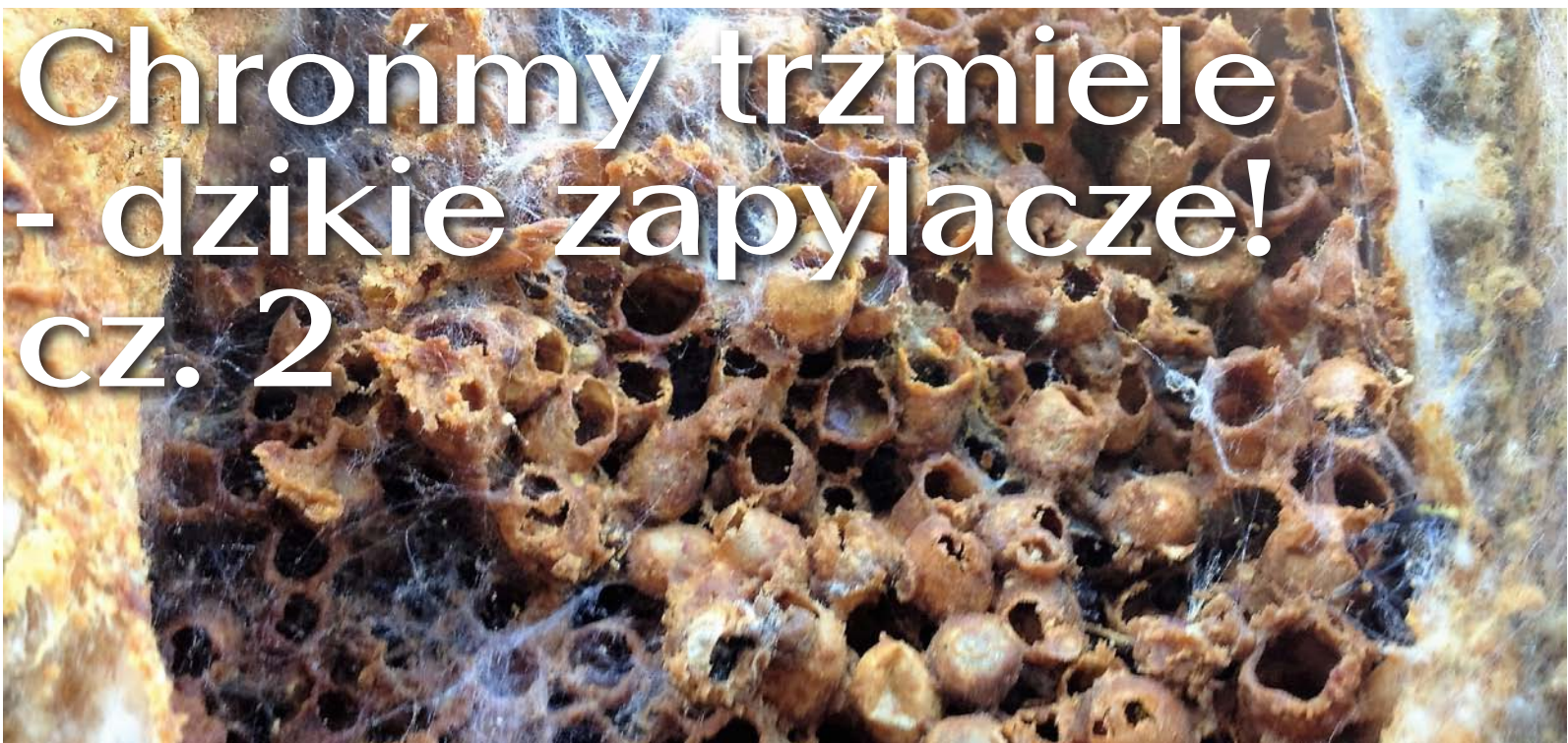
Opuszczone gniazdo trzmieli

Trzmiele pojawiają się najczęściej w pierwszych dniach kwietnia. Są to zapłodnione jesienią ubiegłego roku matki, które zbudziły się z długiego, 7-8 miesięcznego, snu zimowego. Spotkać je można na najwcześniej rozkwitających krokusach, przebiśniegach, ciemierniku, pierwiosnkach, sasankach, a poza ogrodami – na wierzbach, klonach, ałyczach, kokoryczy, mioduncie, jasnocie purpurowej, plamistej i białej itp. Matki latają do połowy maja i w tym czasie zakładają rodziny.