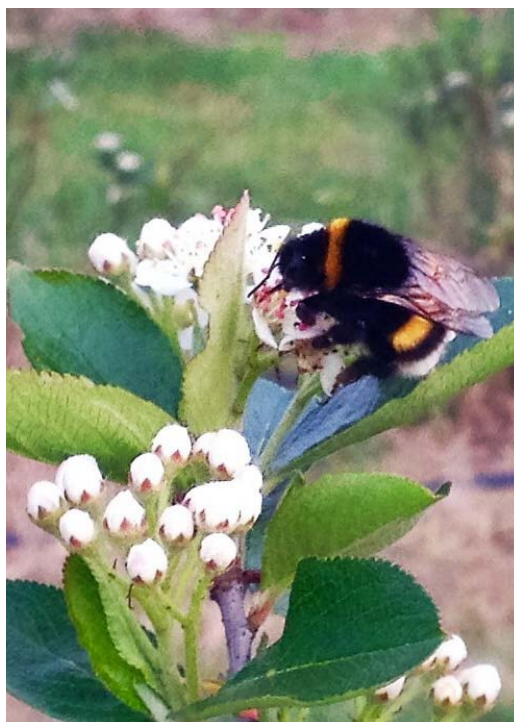
Trzmiel ziemny na kwiatach aronii

Trzmiele są ponadto wydajnymi zapylaczami, oblatującymi w ciągu 1 minuty, np. do 25 kwiatów koniczyny czerwonej, podczas gdy pszczoła miodna jedynie 12-14.