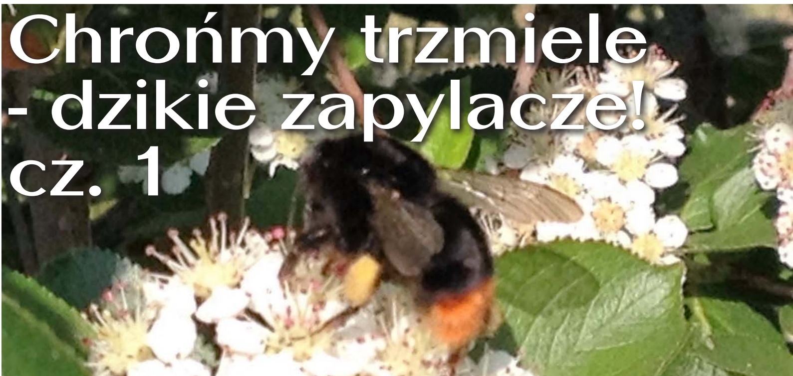
Trzmiel kamieniak na kwiatach aronii

TRZMIEL - Bombus to rodzaj prawnie chronionych owadów społecznych z rodziny pszczołowatych, obejmujący ponad 300 gatunków, żyjących głównie w strefie klimatu umiarkowanego, w tym około 30 gatunków trzmieli występuje w Polsce. Wśród nich jest około 8-12 gatunków spotykanych częściej, jak trzmiel ziemny ( B. terrestris ), kamiennik ( B. lapidarius ), gajowy ( B. lucorum ), rudy ( B. agrorum ), rudonogi ( B. ruderarius ), rudoszary ( B. sylvarum ), żółty ( B. muscorum ) i ogrodowy ( B. hortorum ).