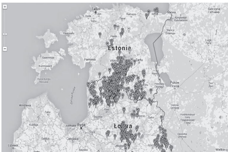
Rys. 1 Rozprzestrzenienie przypadków i ognisk ASF na Łotwie i w Estonii