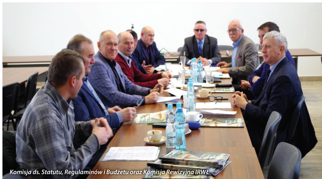
Komisja ds. Statutu, Regulaminów i Budżetu oraz Komisja Rewizyjna IRWŁ