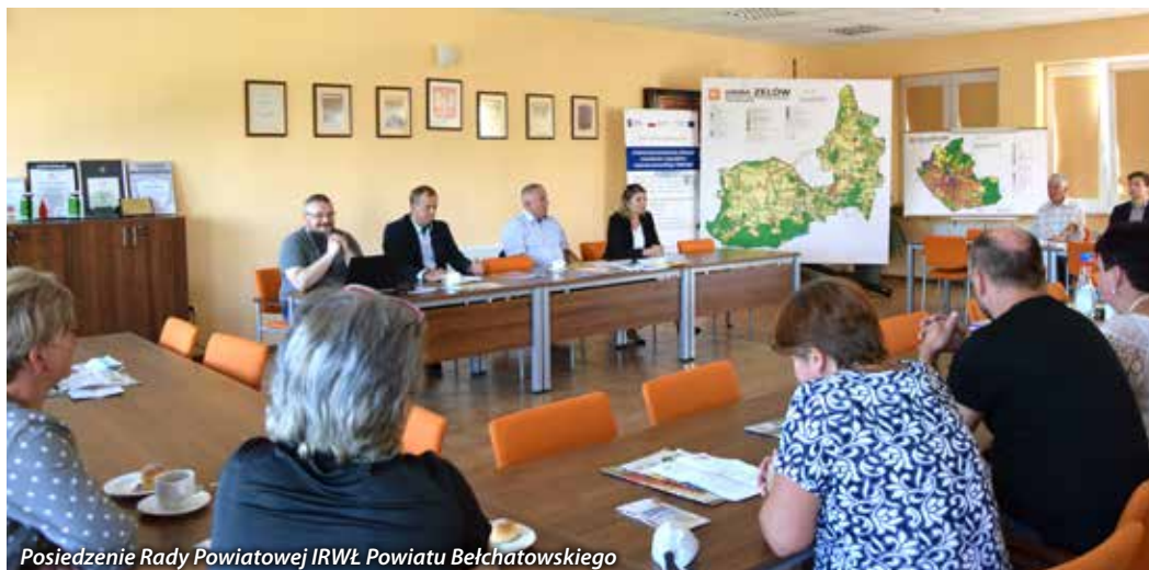
Posiedzenie Rady Powiatowej IRWŁ Powiatu Bełchatowskiego