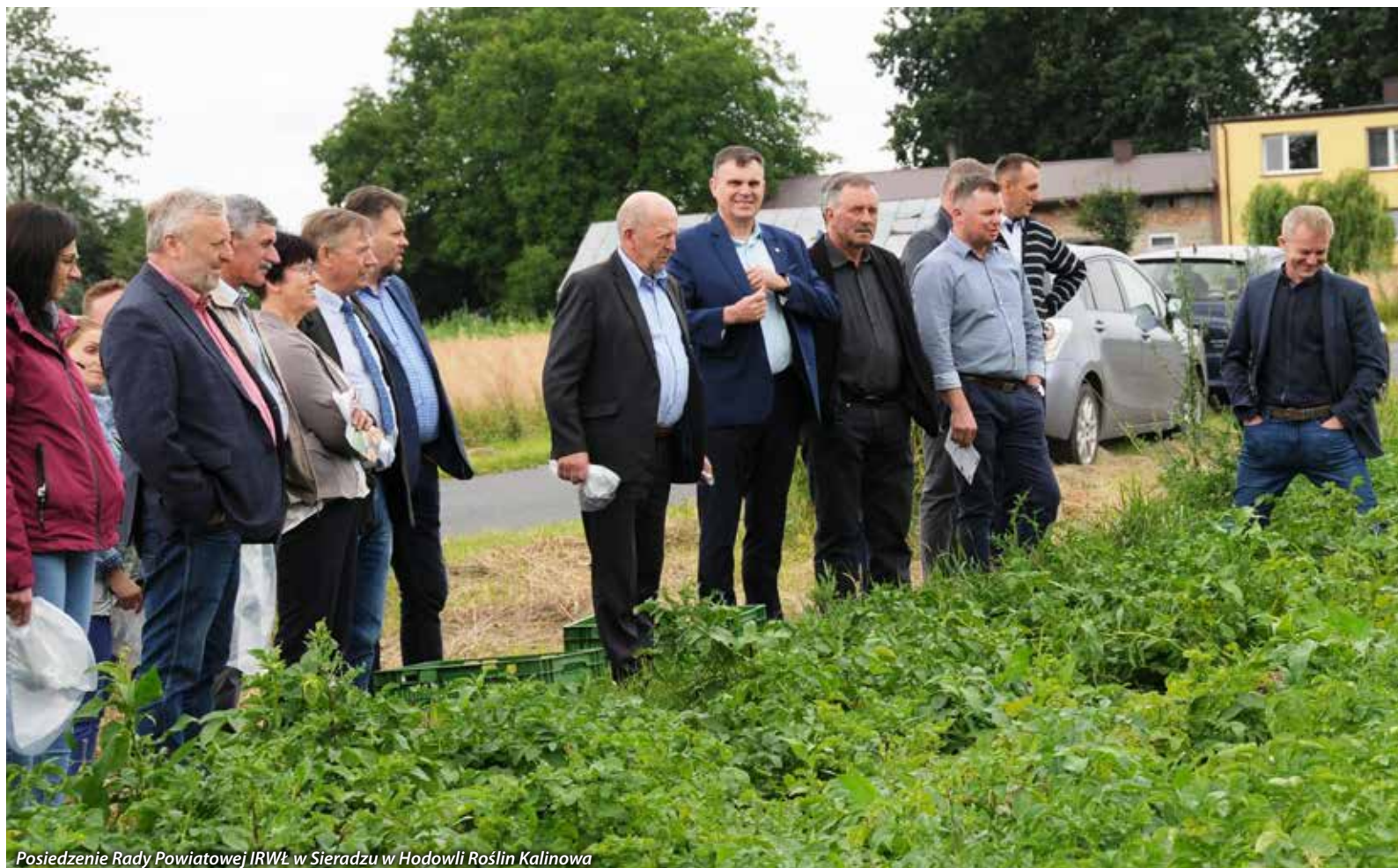
Posiedzenie Rady Powiatowej IRWŁ w Sieradzu w Hodowli Roślin Kalinowa